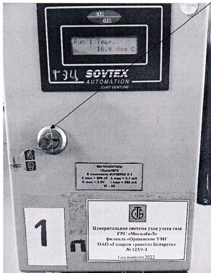
Рисунок 3.1 – Схема пломбировки от несанкционированного доступа

Место пломбировки от несанкционированного доступа