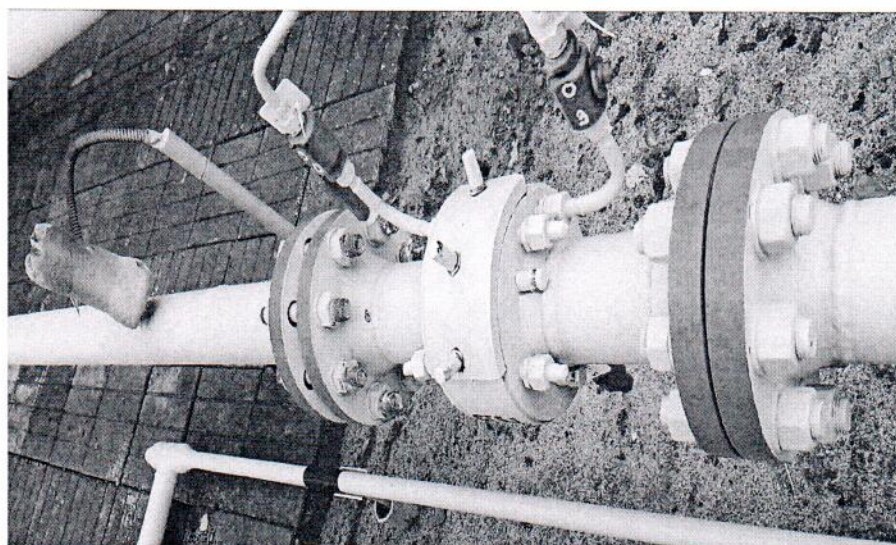
Рисунок 1.1 – Фотографии общего вида ИС УУГ