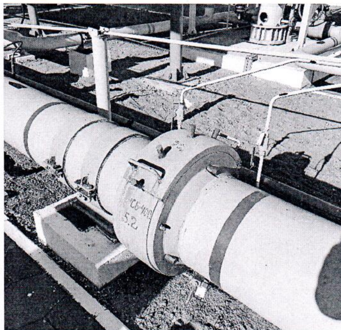
Рисунок 1.1 – Фотографии общего вида ИС УУГ