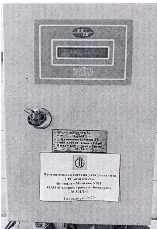
Рисунок 1.1 – Фотографии общего вида ИС УУГ