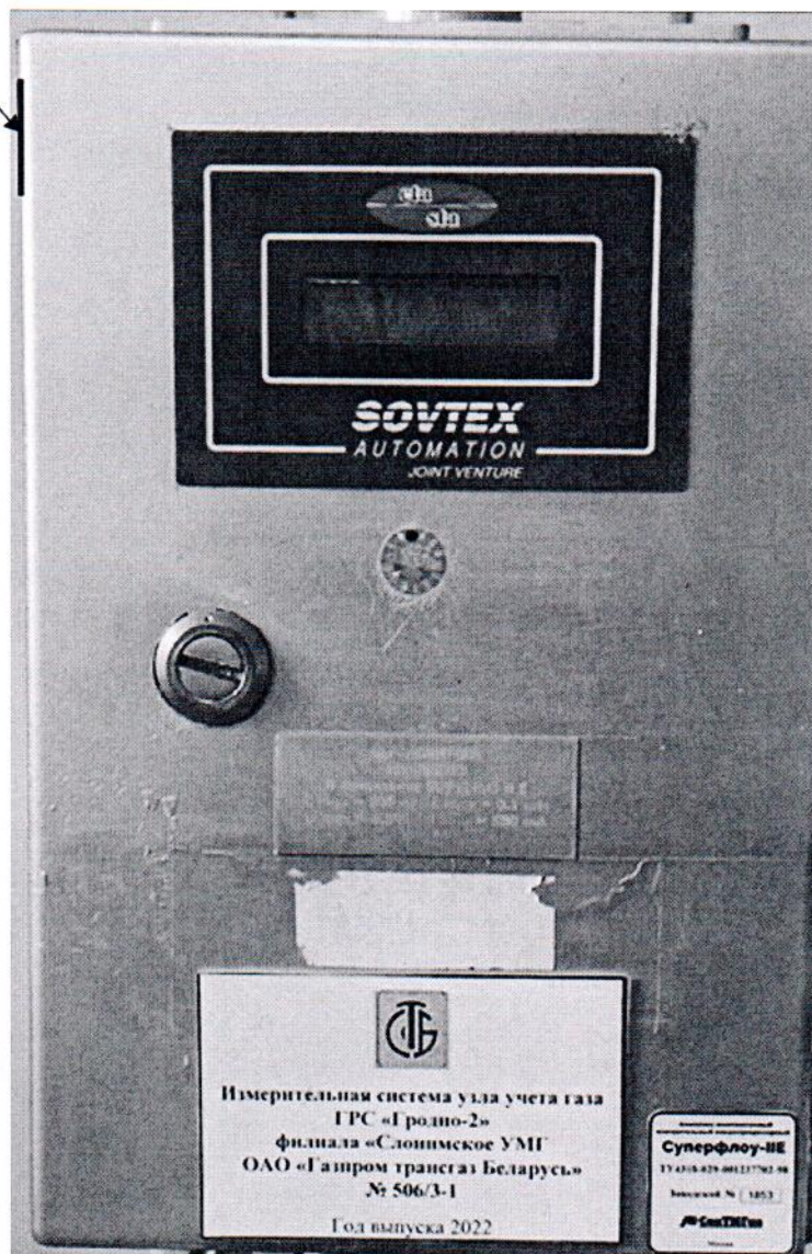
Рисунок 3.1 – Схема пломбировки от несанкционированного доступа

Место пломбировки от несанкционированного доступа