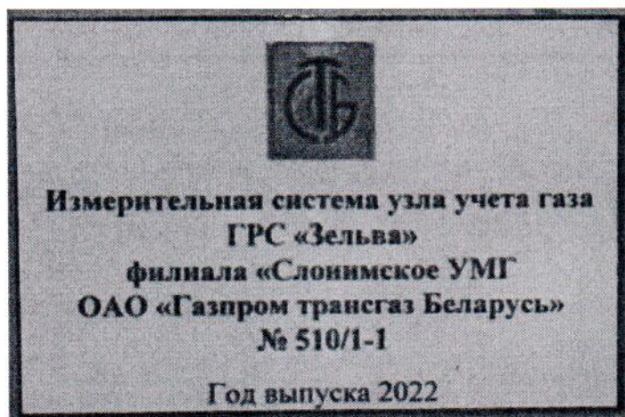
Рисунок 1.2 – Фотография маркировки ИС УУГ