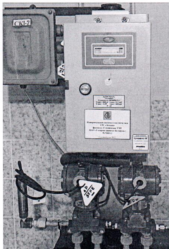
Рисунок 1.1 – Фотографии общего вида ИС УУГ