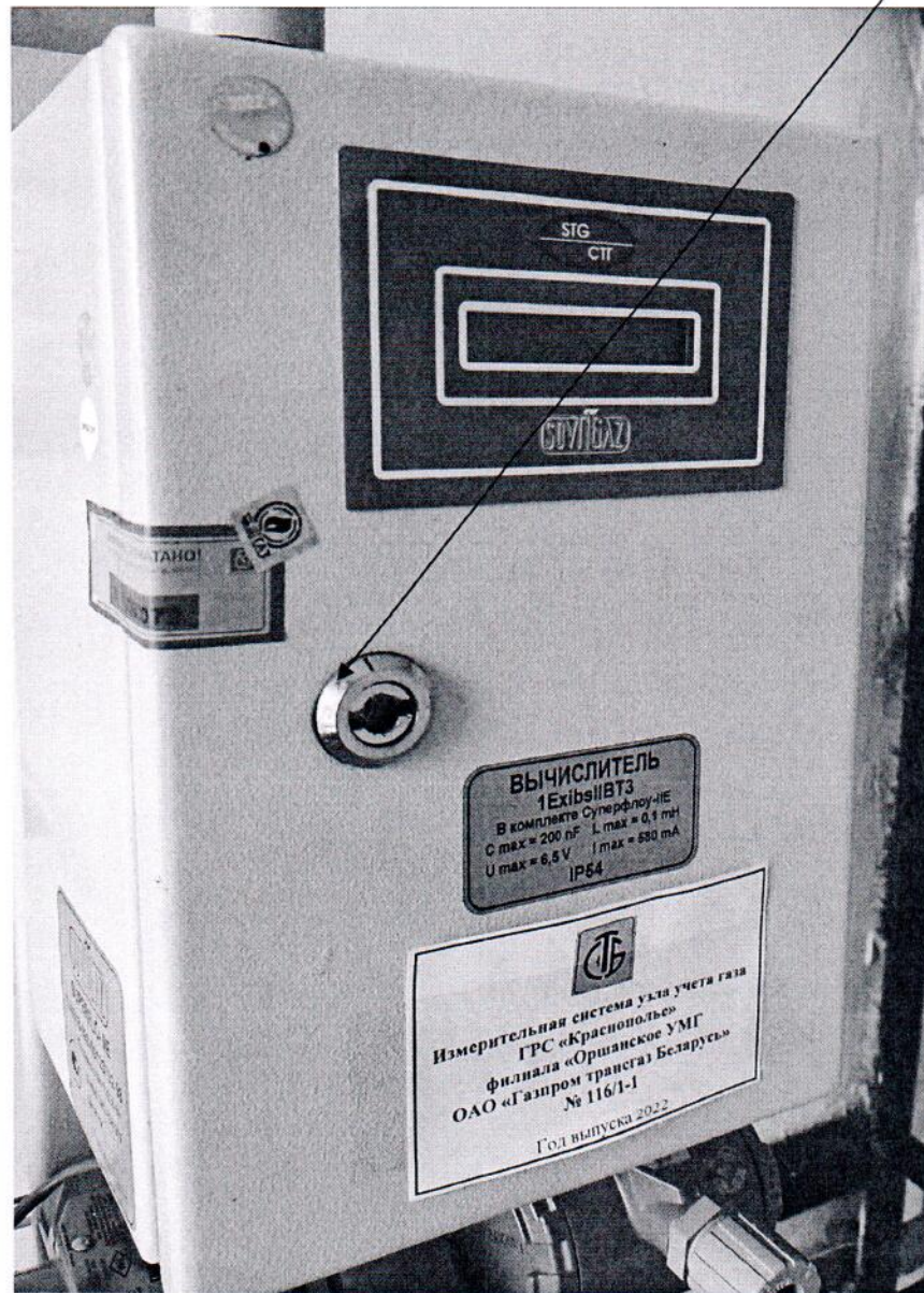
Рисунок 3.1 – Схема пломбировки от несанкционированного доступа

Схема пломбировки от несанкционированного доступа Место пломбировки от несанкционированного доступа