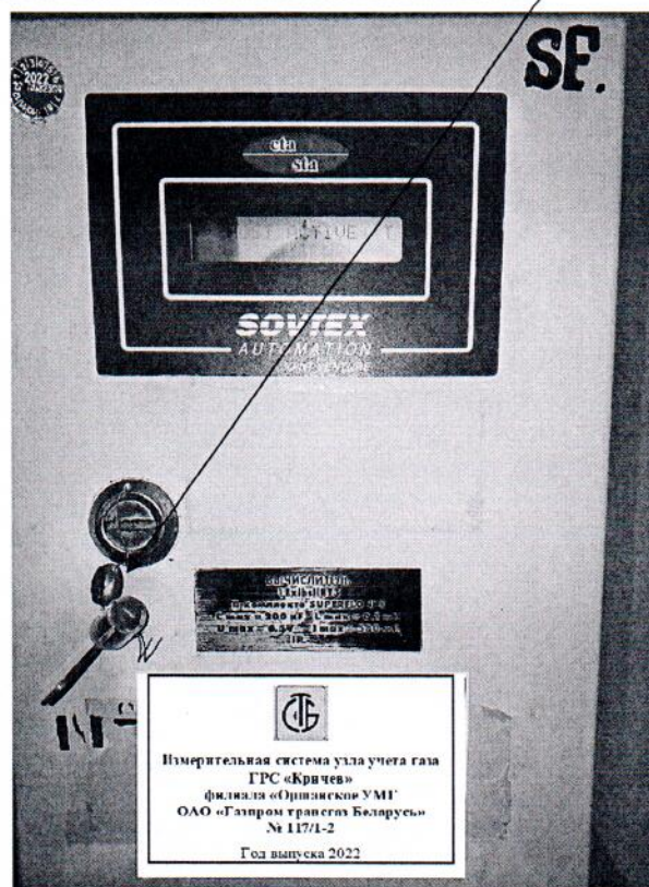
Рисунок 3.1 – Схема пломбировки от несанкционированного доступа

Место пломбировки от несанкционированного доступа