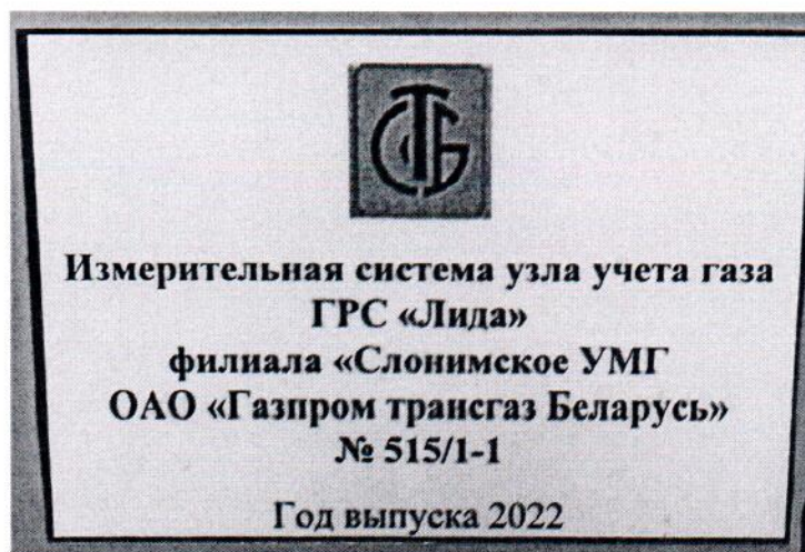
Рисунок 1.2 – Фотография маркировки ИС УУГ