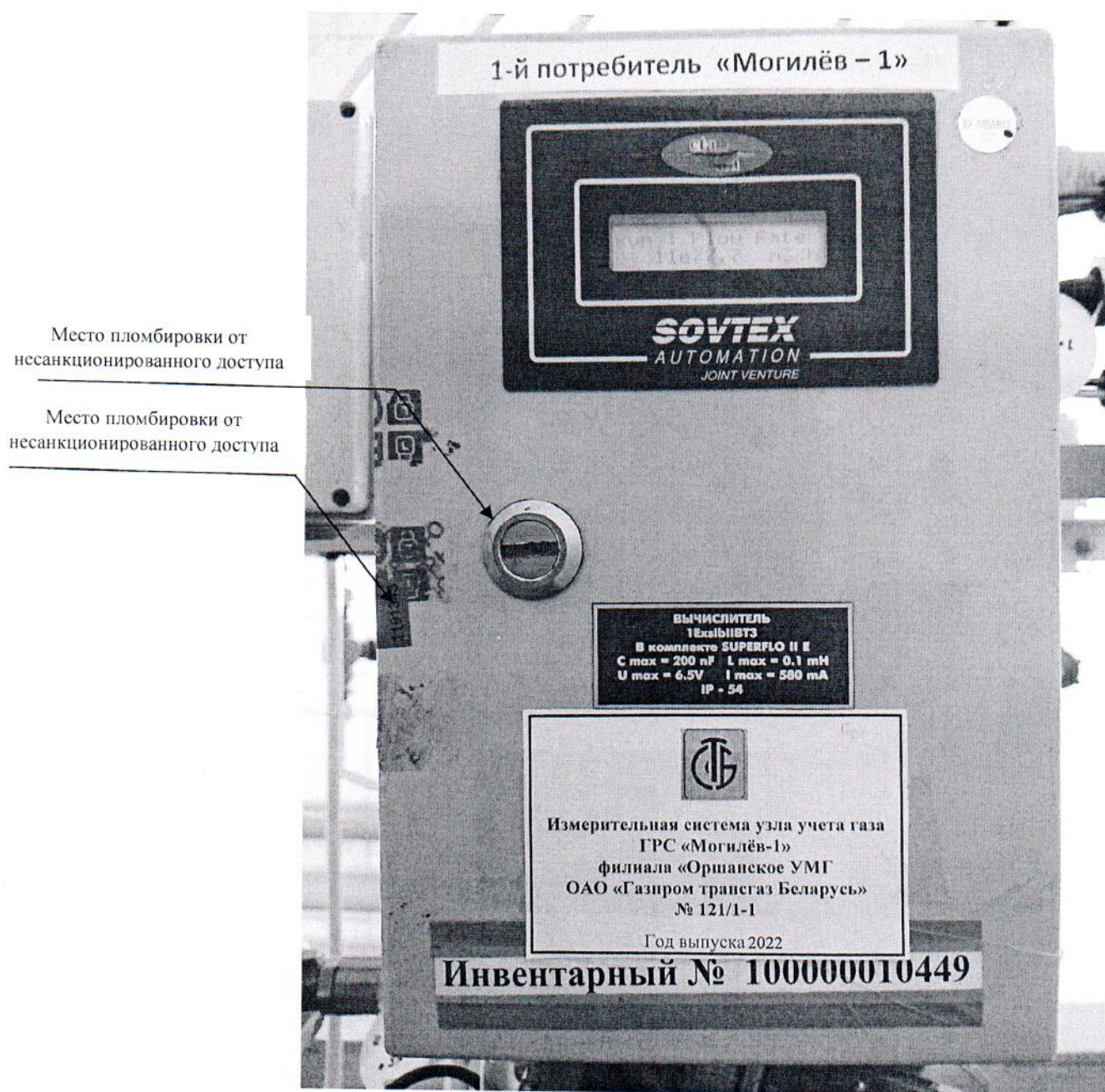
Рисунок 3.1 – Схема пломбировки от несанкционированного доступа