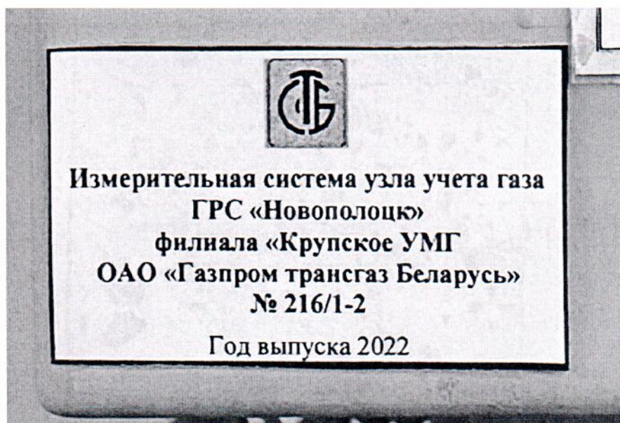
Рисунок 1.2 – Фотография маркировки ИС УУГ