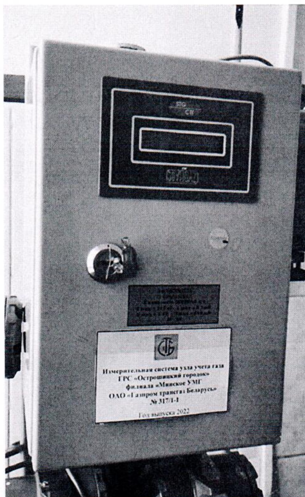
Рисунок 1.1 – Фотографии общего вида ИС УУГ