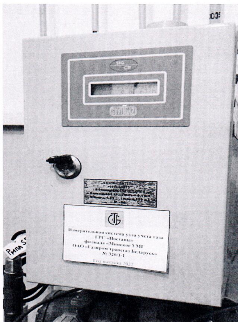
Рисунок 1.1 – Фотографии общего вида ИС УУГ