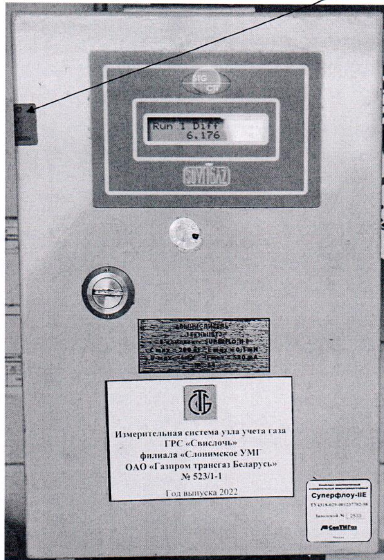
Рисунок 3.1 – Схема пломбировки от несанкционированного доступа

Место пломбировки от несанкционированного доступа