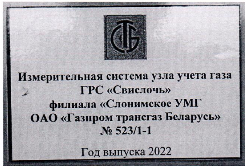
Рисунок 1.2 – Фотография маркировки ИС УУГ