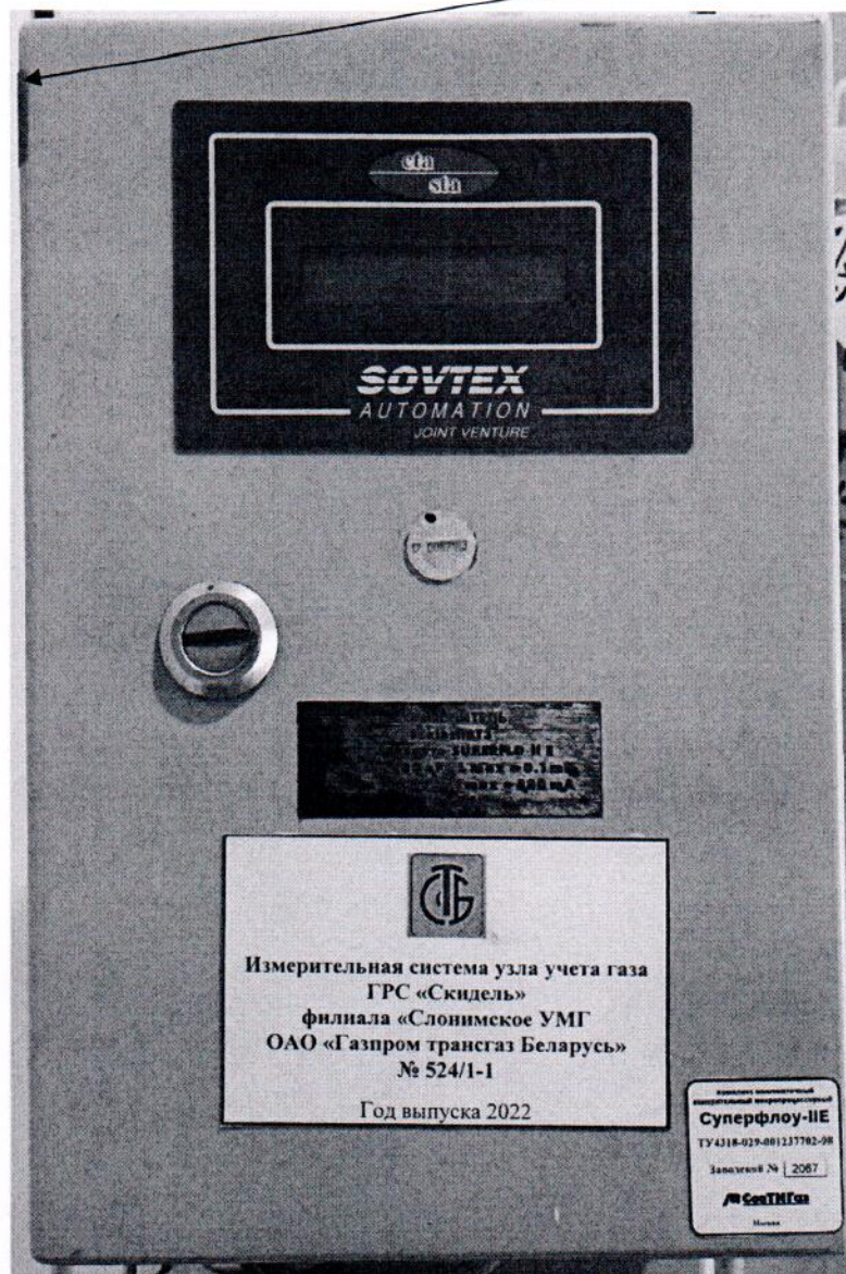
Рисунок 3.1 – Схема пломбировки от несанкционированного доступа

Место пломбировки от несанкционированного доступа