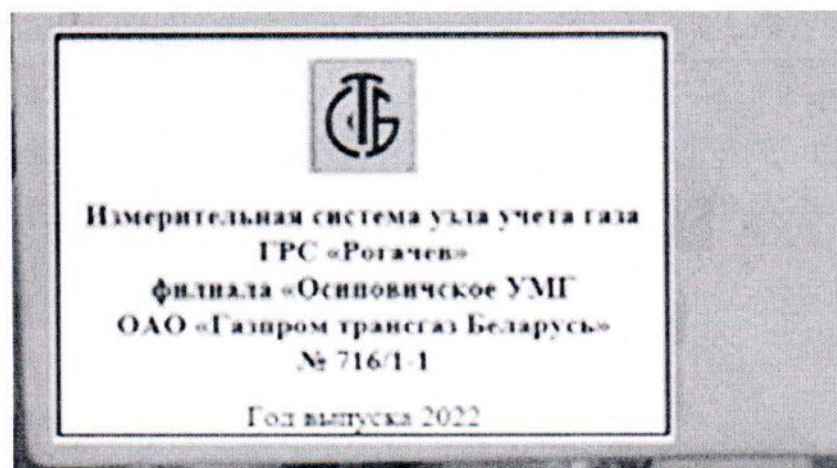
Рисунок 1.2 – Фотография маркировки ИС УУГ