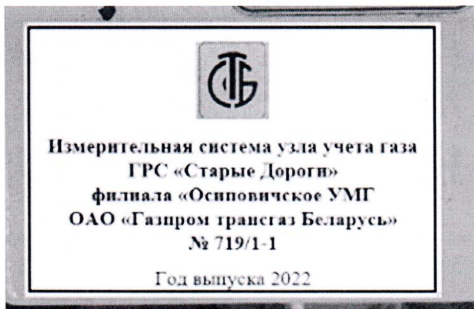
Рисунок 1.2 – Фотография маркировки ИС УУГ