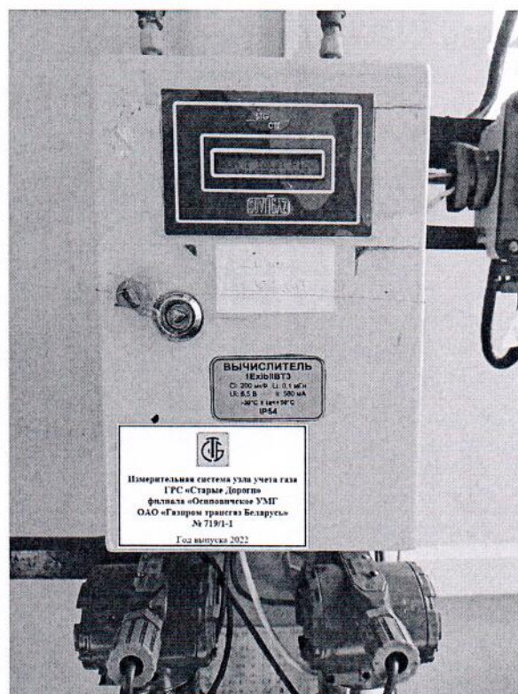
Рисунок 1.1 – Фотографии общего вида ИС УУГ