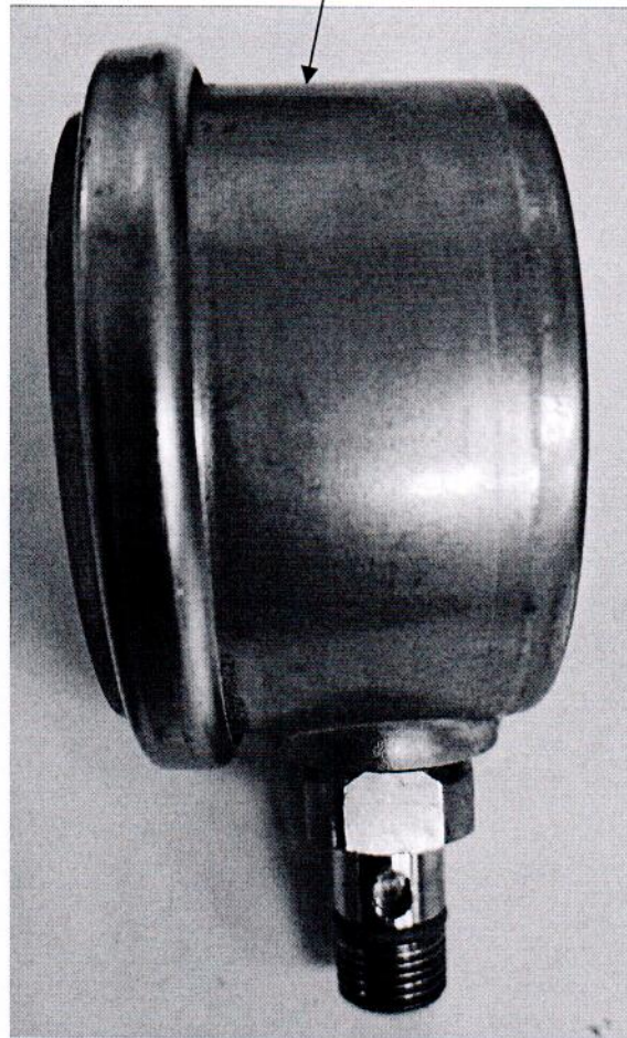
Рисунок 2.1 – Схема (рисунок) с указанием места для нанесения знака поверки средств измерений

Место для нанесения знака поверки средств измерений