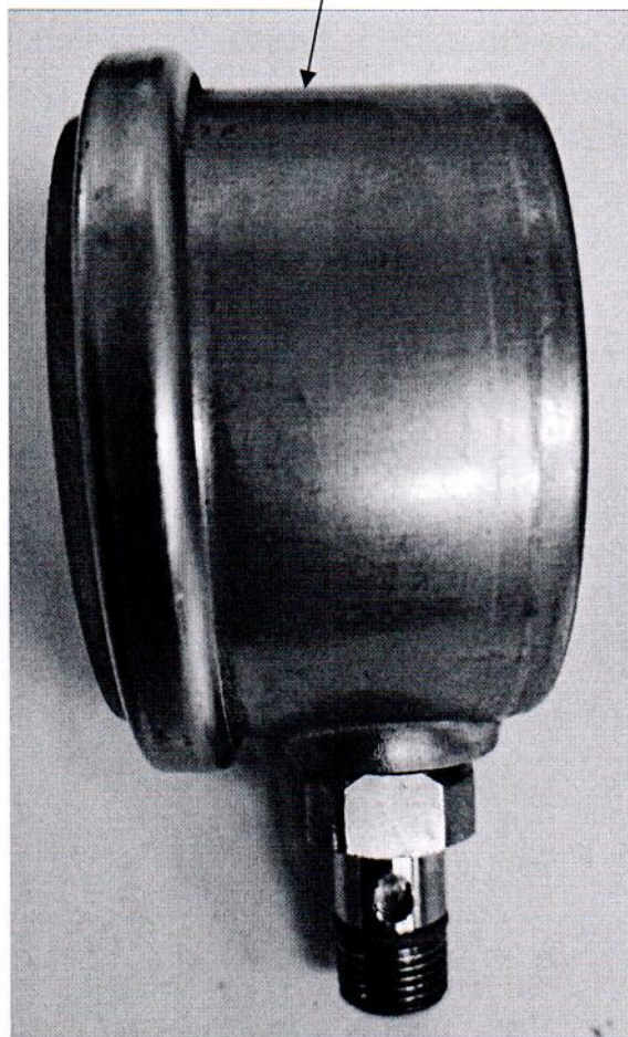
Рисунок 2.1 – Схема (рисунок) с указанием места для нанесения знака поверки средств измерений

Место для нанесения знака поверки средств измерений