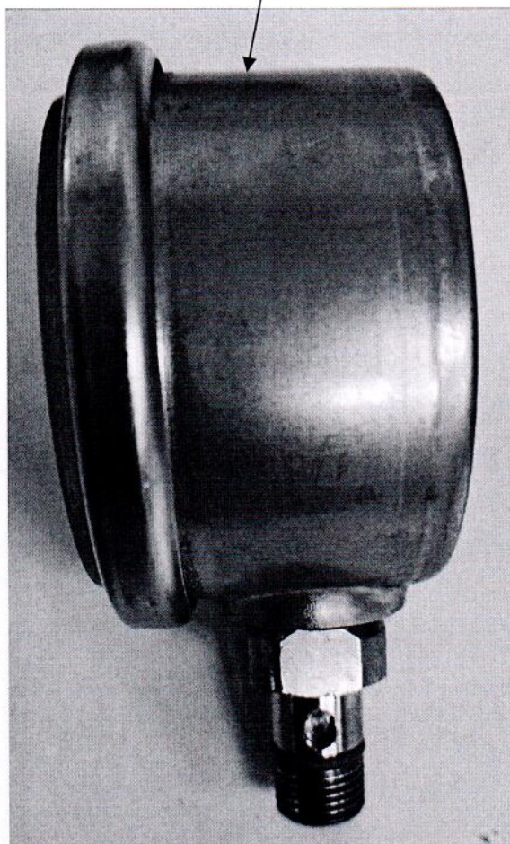
Рисунок 2.1 – Схема (рисунок) с указанием места для нанесения знака поверки средств измерений

Место для нанесения знака поверки средств измерений