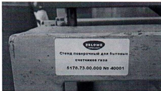
Рисунок 1.2 – Фотография маркировки стенда