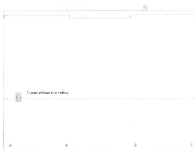
Рисунок 2 - Место пломбирования от несанкционированного доступа