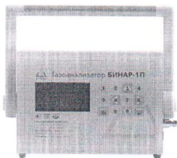
а) газоанализатор переносной "Бинар-1П"

Знак поверки наносится на свидетельство о поверке.