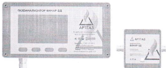
г) газоанализатор стационарный "Бинар-2Д" с индикацией в пластиковом корпусе с выносным датчиком