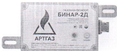
в) газоанализатор стационарный "Бинар-2Д" без индикации в металлическом корпусе