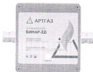
д) газоанализатор стационарный "Бинар-2Д" без индикации в пластиковом корпусе