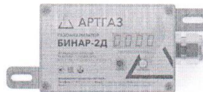
б) газоанализатор стационарный "Бинар-2Д" с индикацией в металлическом корпусе