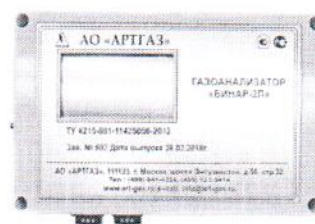
е) газоанализатор стационарный "Бинар-2П"