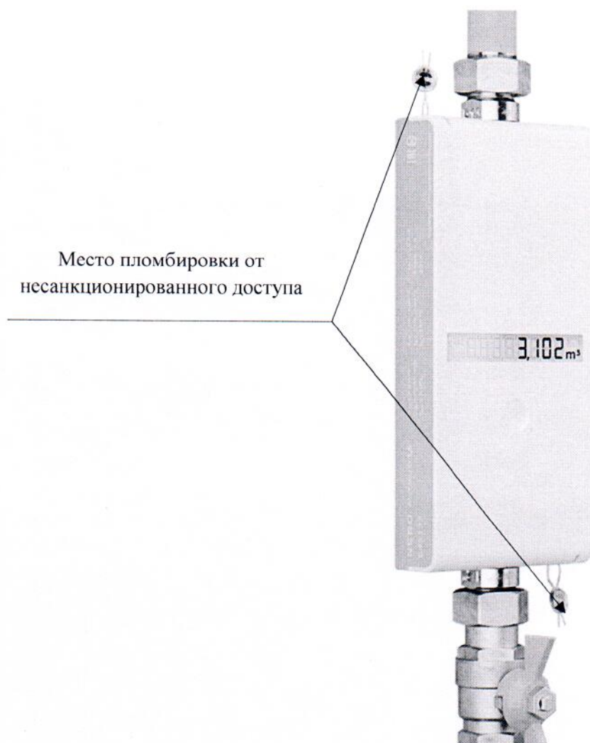
Рисунок 3.1 – Схема пломбировки от несанкционированного доступа