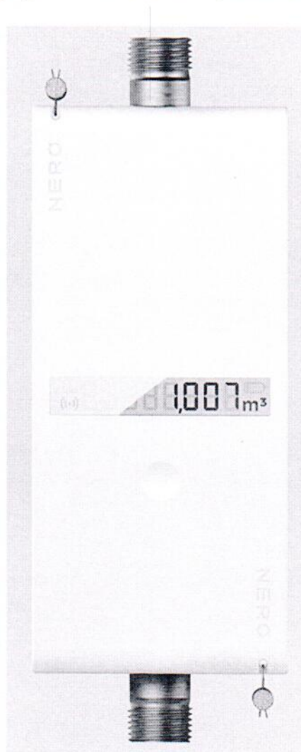
Рисунок 1.1 – Фотографии общего вида счетчиков газа ультразвуковых Metano (изображение носит иллюстративный характер)