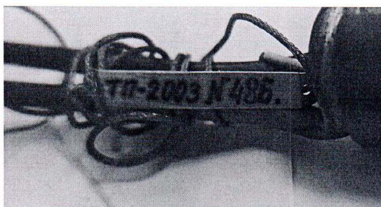
Рисунок 1.2 – Фотография маркировки приемника теплового потока охлаждаемого ТТ-2003 № 486