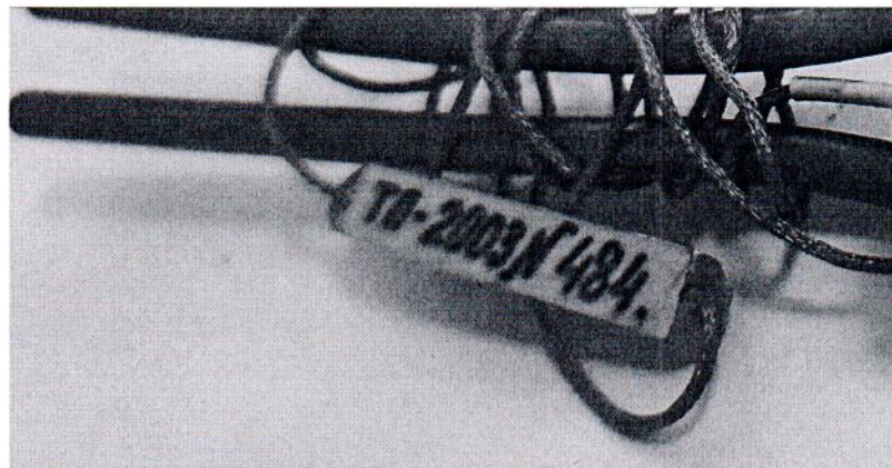
Рисунок 1.2 – Фотография маркировки приемника теплового потока охлаждаемого ТП-2003 № 484