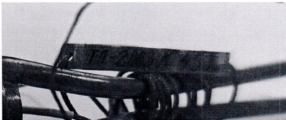
Рисунок 1.2 – Фотография маркировки приемника теплового потока охлаждаемого ТП-2003 № 453