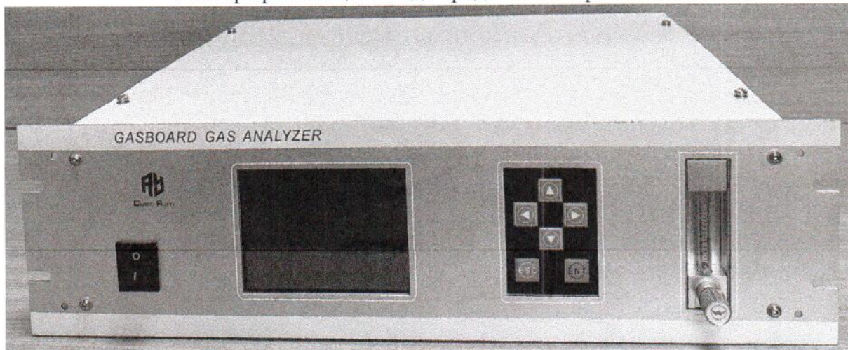
Рисунок 1.1 – Фотография общего вида. Анализатор газа Gasboard-3000Plus, зав. № 221205130001