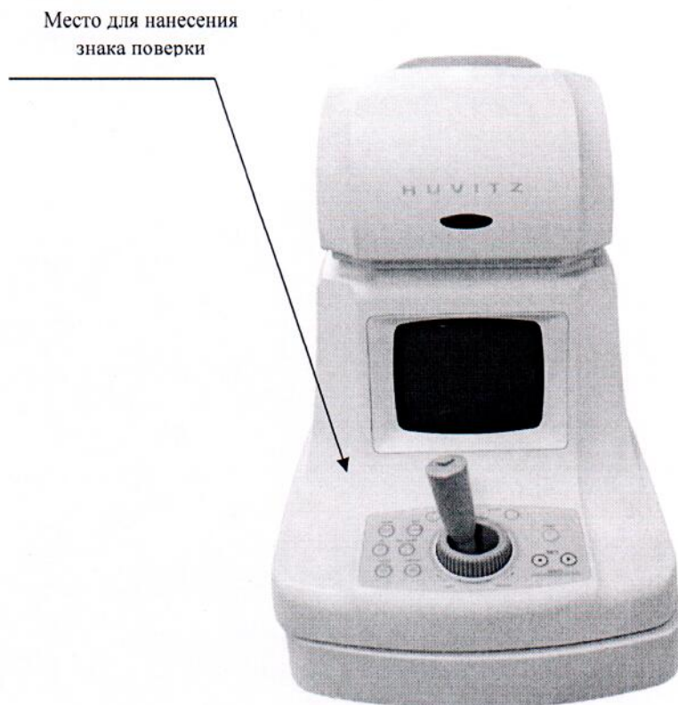
Рисунок 2.1–Схема (рисунок) с указанием места для нанесения знака поверки

Схема (рисунок) с указанием места для нанесения знака поверки средств измерений