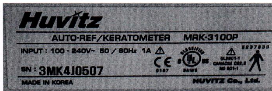
Рисунок 1.2 – Фотография маркировки авторефрактомерометра MRK-3100P № 3МК4J0507