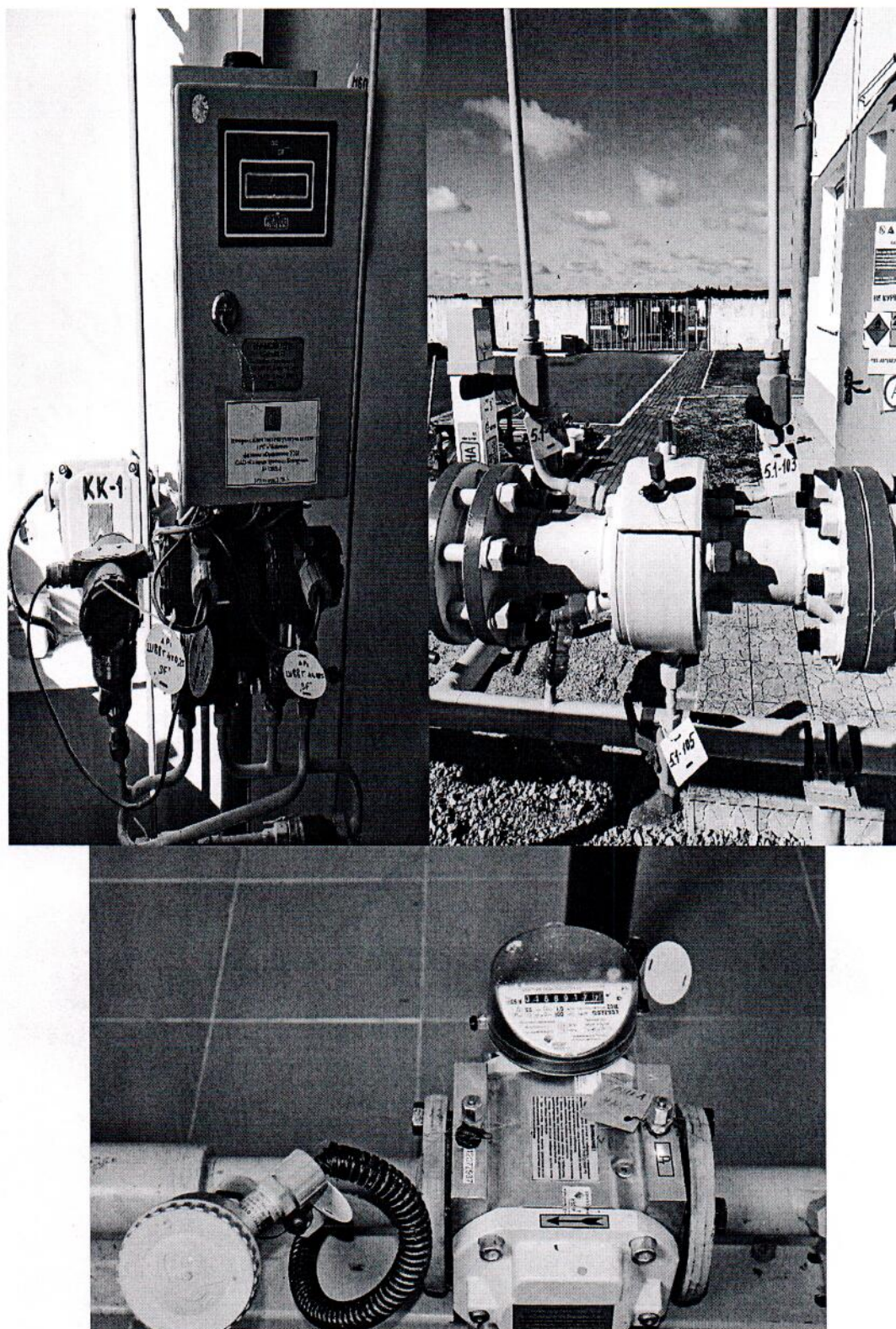
Рисунок 1.1 – Фотографии общего вида ИС УУГ