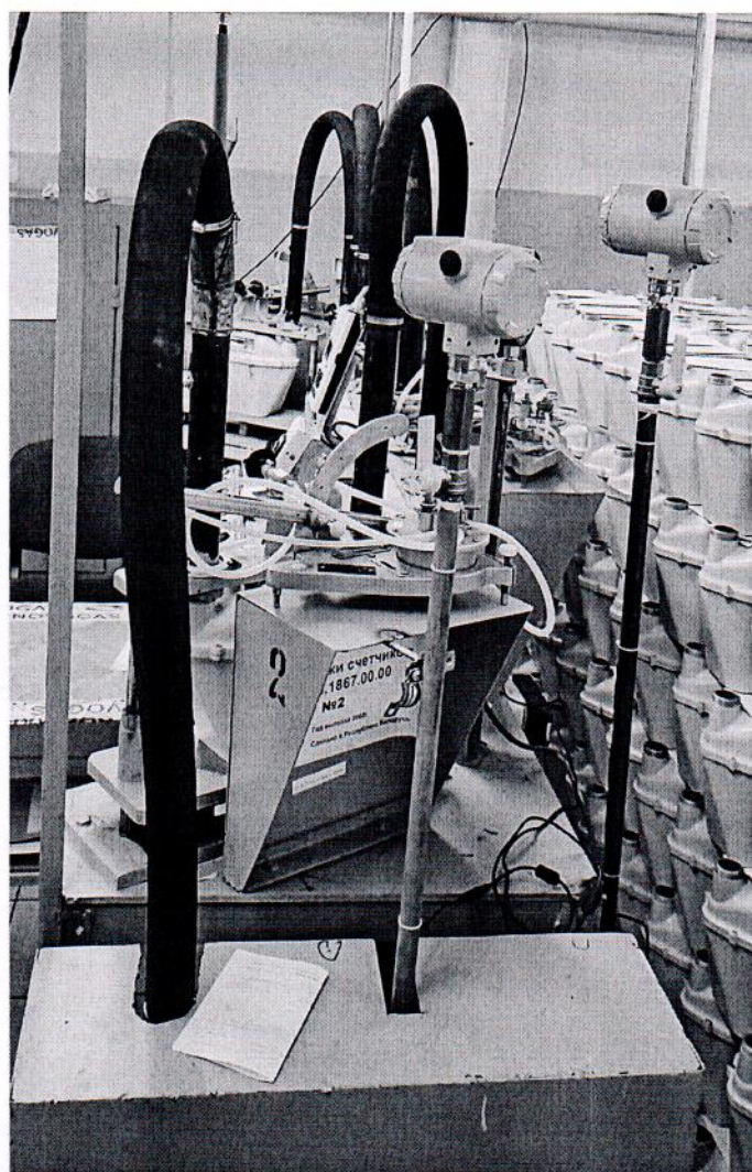
Рисунок 1.1 – Фотографии общего вида стенда поверки счетчиков газа 9000.1867.00.00 № 2