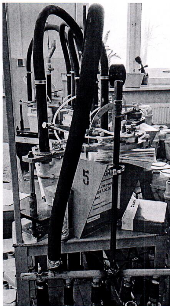
Рисунок 1.1 – Фотографии общего вида стенда поверки счетчиков газа 9000.1867.00.00 № 5