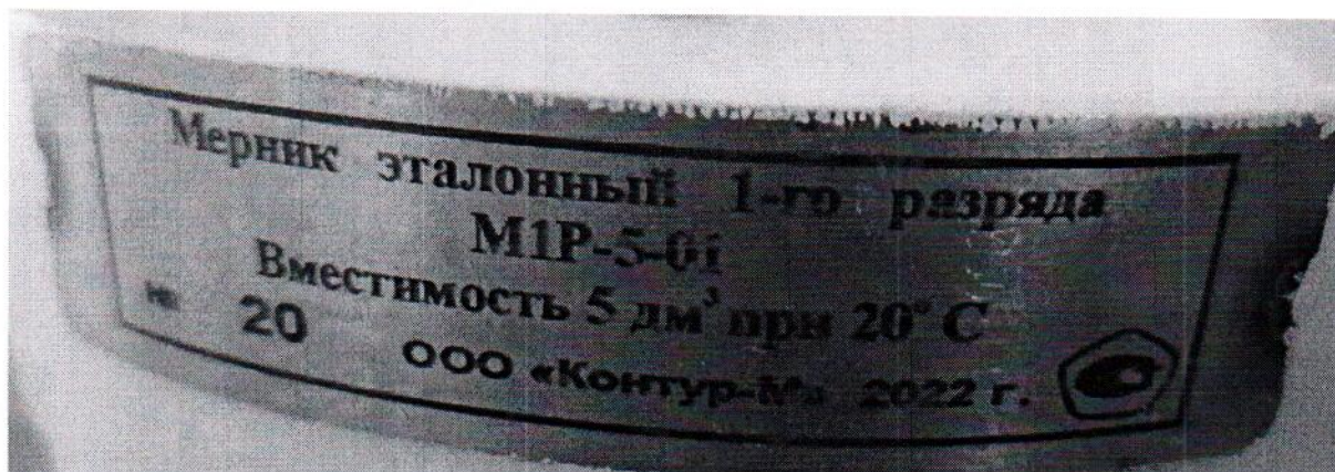
Рисунок 1.2 – Маркировка мерника эталонного 1-го разряда М1Р-5-01 № 20