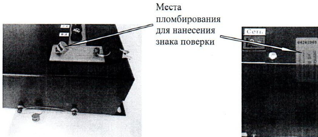
Рисунок 5 - Схемы пломбировки отсчетного устройства Север-4К и ЭКО и нанесения знака поверки