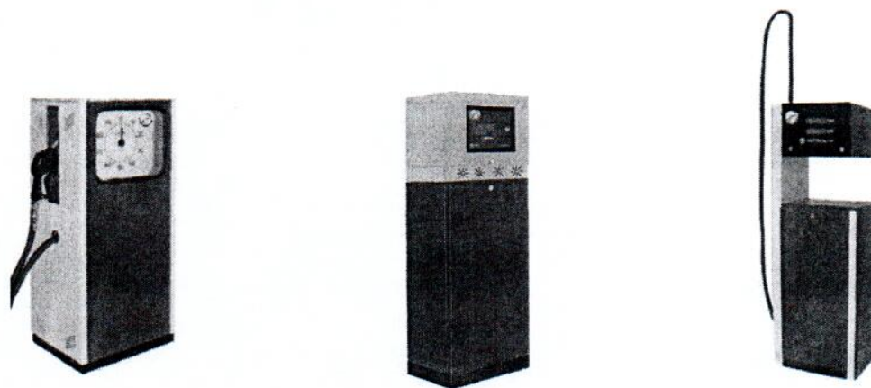
Рисунок 1 - Общий вид колонок

Схема пломбировки от несанкционированного доступа, обозначение места нанесения знака поверки представлены на рисунках 3 - 5.