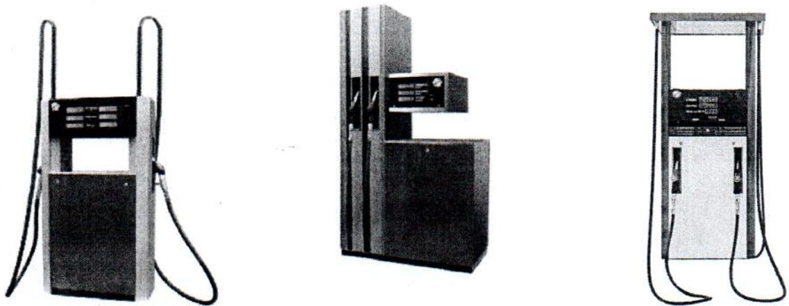
Рисунок 2 - Общий вид колонок