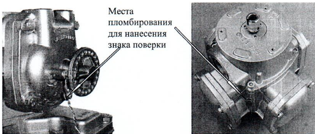
Рисунок 3 - Схемы пломбировки объемного счетчика жидкости типа RSJ-50 и нанесения знака поверки