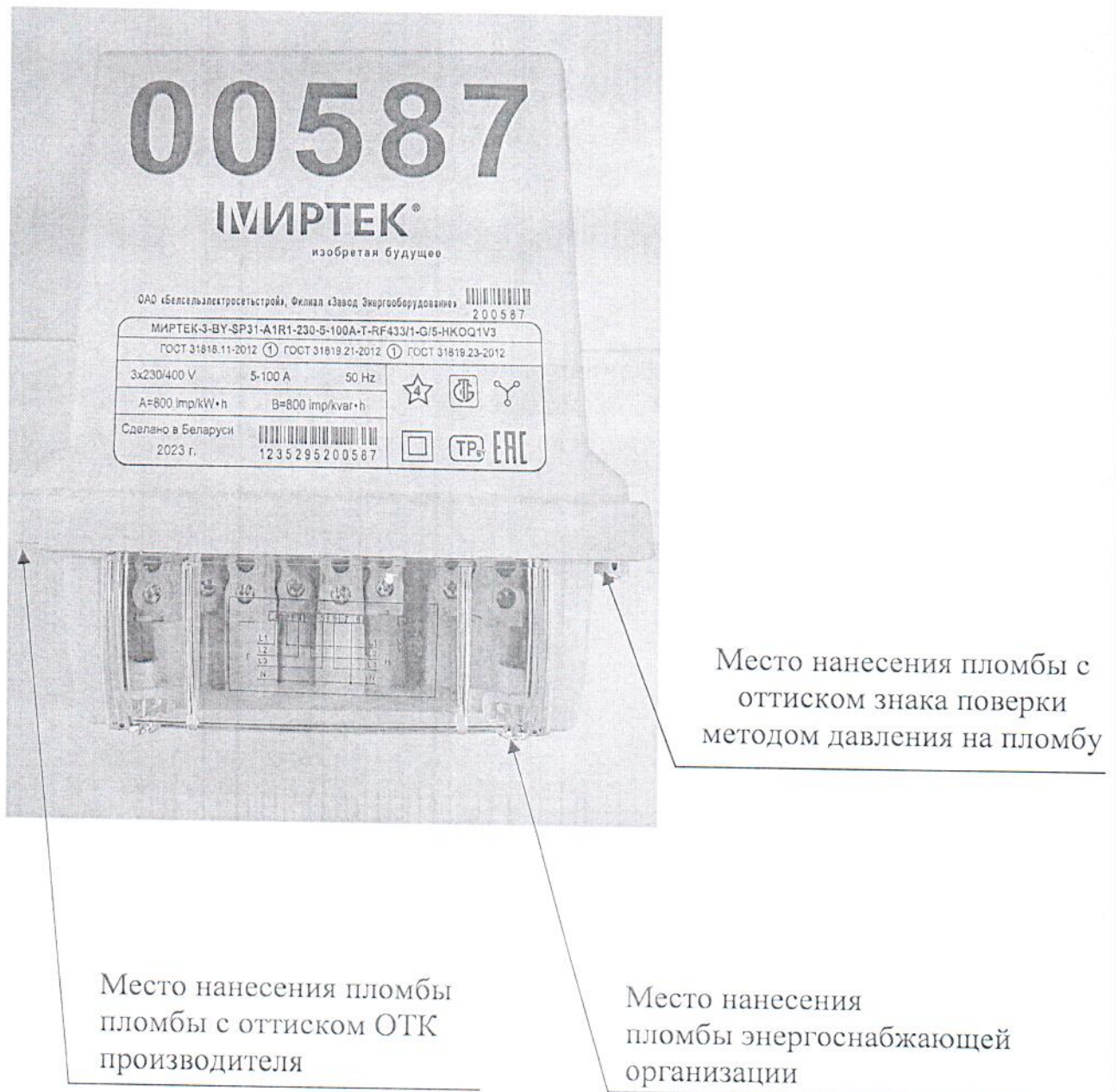
Рисунок 3.1 – Схема пломбировки счетчика от несанкционированного доступа