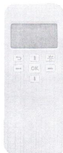
Рисунок 1.2 – Фотография общего вида выносного модуля отображения информации МИРТ-830