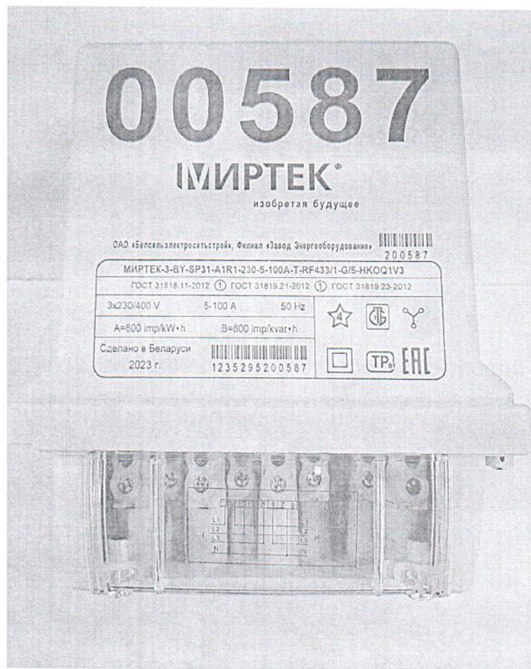
Рисунок 1.1 – Фотография общего вида счетчика