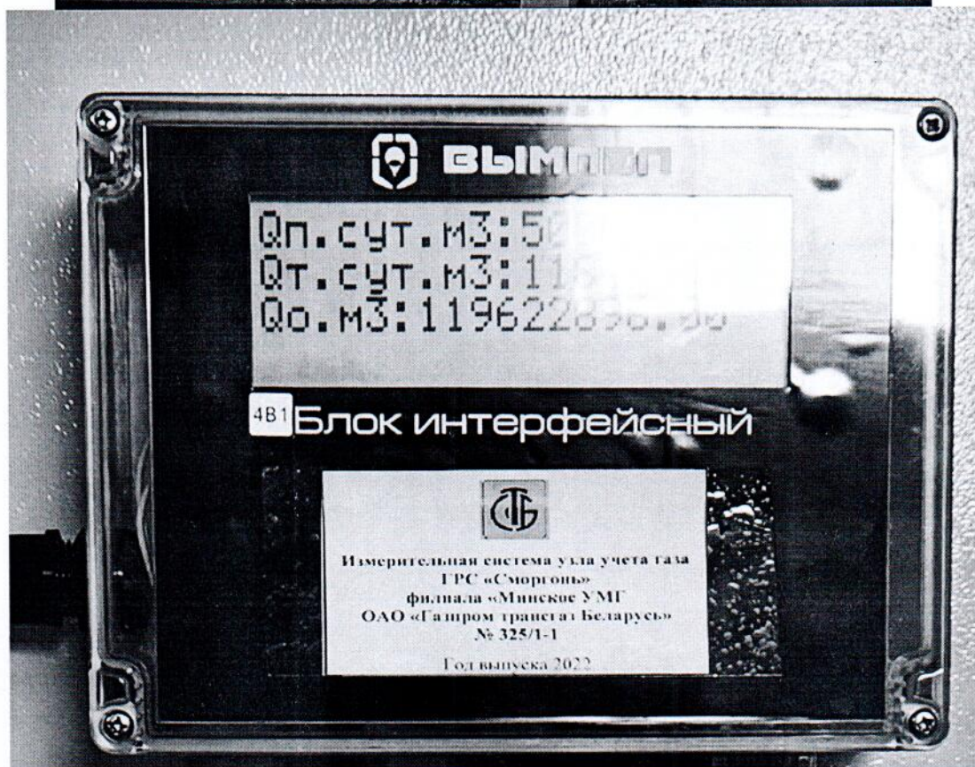
Рисунок 1.1 – Фотографии общего вида ИС УУГ