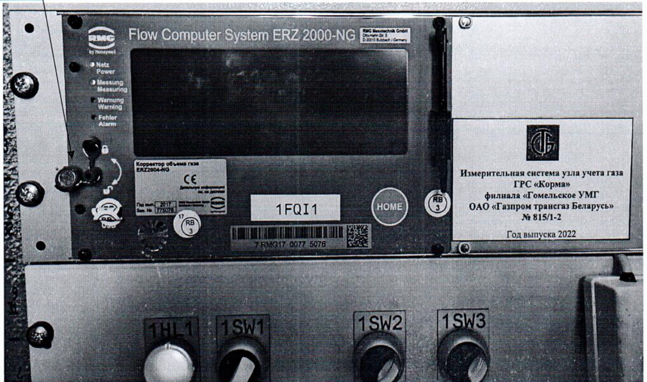
Рисунок 3.1 – Схема пломбировки от несанкционированного доступа

Место пломбировки от несанкционированного доступа