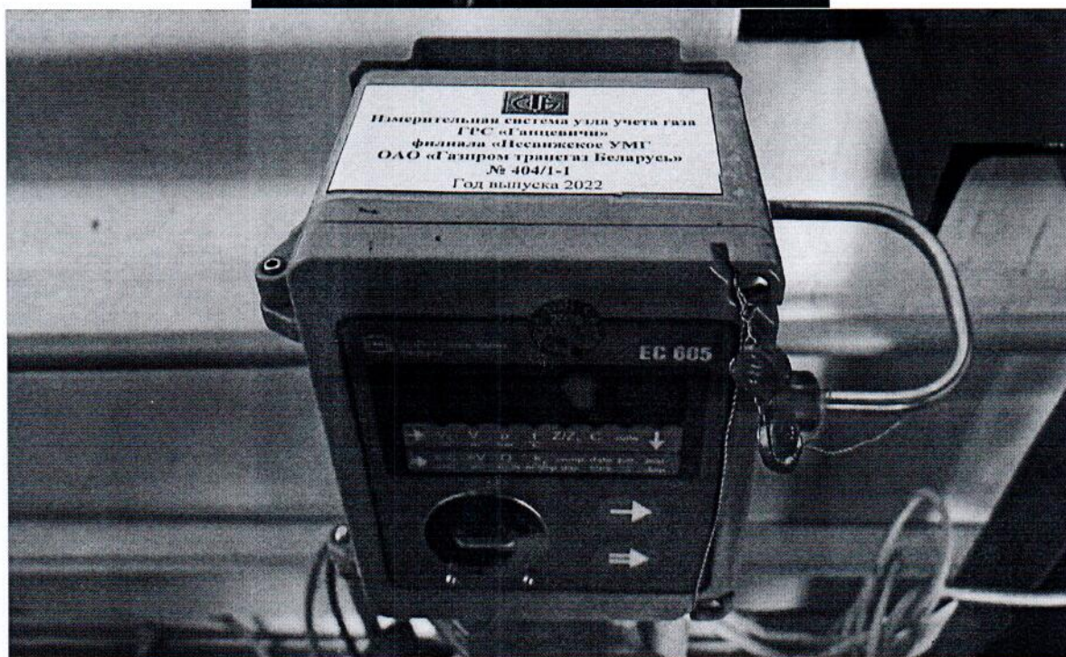
Рисунок 1.1 – Фотографии общего вида ИС УУГ