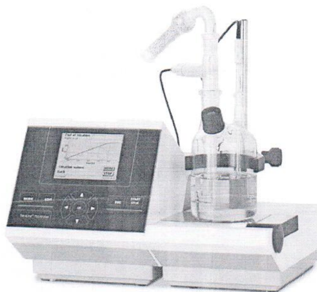
Рисунок 2 – Внешний вид титраторов TitroLine 7500 KF trace