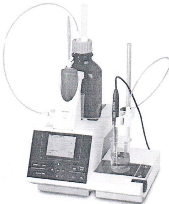
Рисунок 1 – Внешний вид титраторов TitroLine 6000, TitroLine 7000

Место нанесения знака поверки в виде клейма-наклейки указано в приложении А.