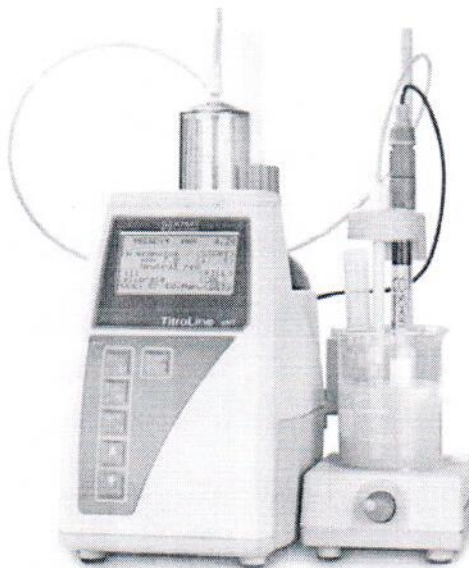
Рисунок 4 – Внешний вид титраторов TitroLine Easy