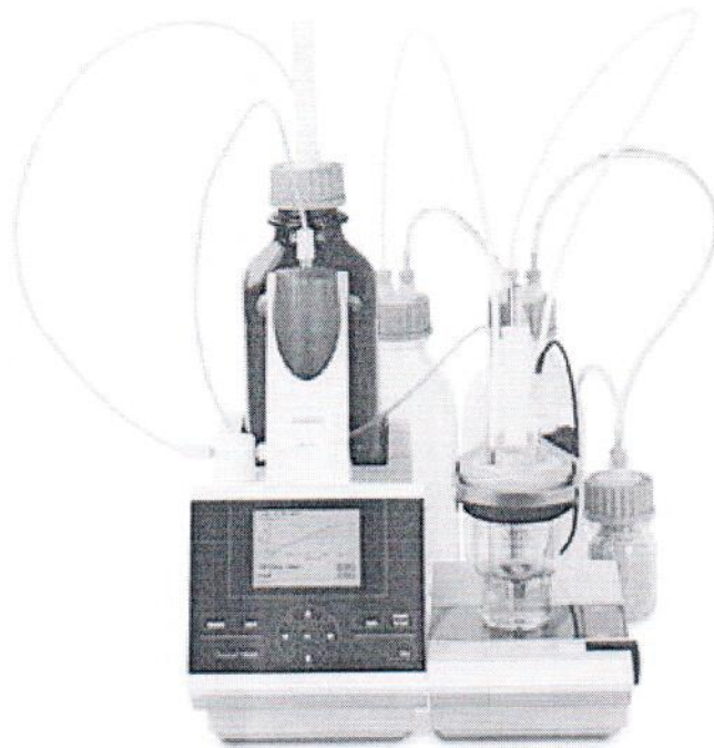
Рисунок 5 – Внешний вид титраторов TitroLine 7750