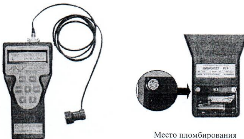
Рисунок 1- Внешний вид прибора виброизмерительного ВИБРОТЕСТ-МГ4

Внешний вид прибора виброизмерительного ВИБРОТЕСТ-МГ4 приведен на рисунке 1.