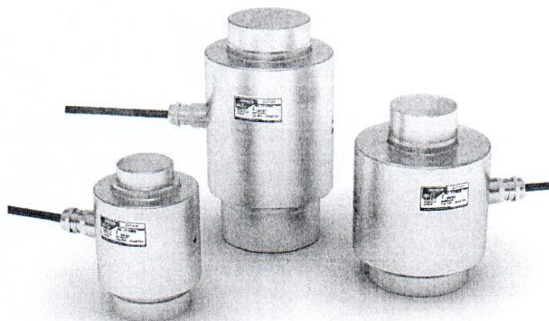
Рисунок 1 – Внешний вид датчиков

Внешний вид датчиков показан на рисунке 1.