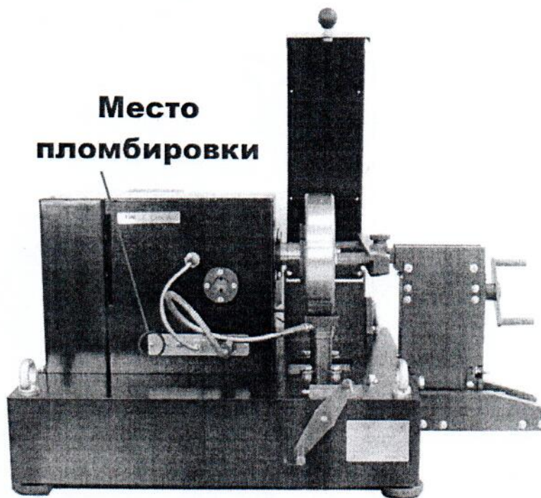
Рисунок 3 - Схема пломбировки средства измерений от несанкционированного доступа