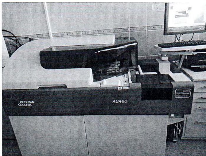
Рисунок 1.1 – Фотография общего вида анализатора биохимического автоматического AU480 № 2021114412