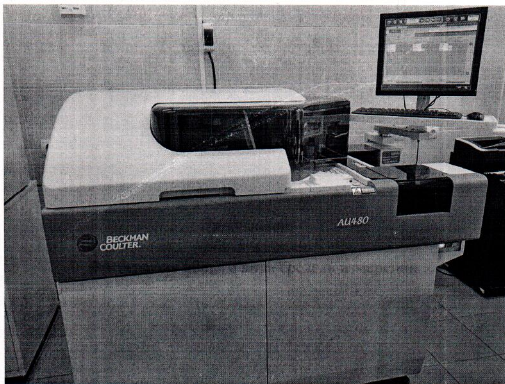
Рисунок 1.1 – Фотография общего вида анализатора AU480, № 2021084242