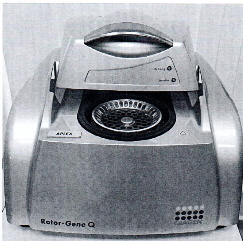
Рисунок 1.1 – Фотография общего вида амплификатора в режиме реального времени Rotor-Gene Q №R0813126