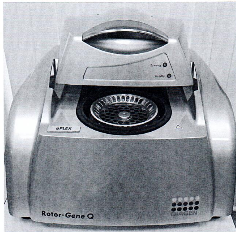
Рисунок 1.1 – Фотография общего вида амплификатора в режиме реального времени Rotor-Gene Q № R0221105