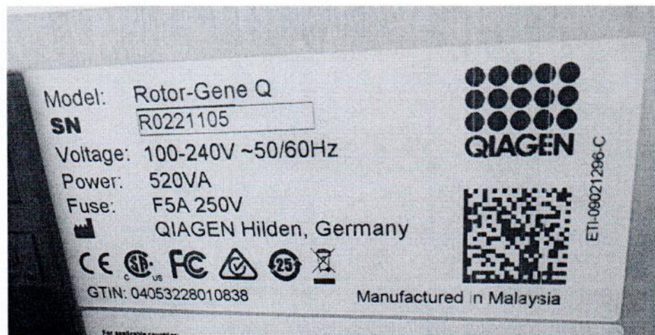
Рисунок 1.2 – Фотография маркировки амплификатора в режиме реального времени Rotor-Gene Q № R0221105