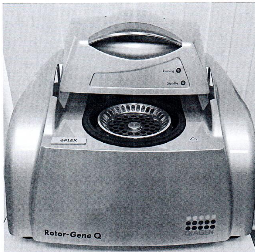
Рисунок 1.1 – Фотография общего вида амплификатора в режиме реального времени Rotor-Gene Q №R0221118

Фотография общего вида средств измерений