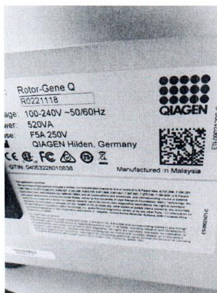
Рисунок 1.2 – Фотография маркировки амплификатора в режиме реального времени Rotor-Gene Q №R0221118