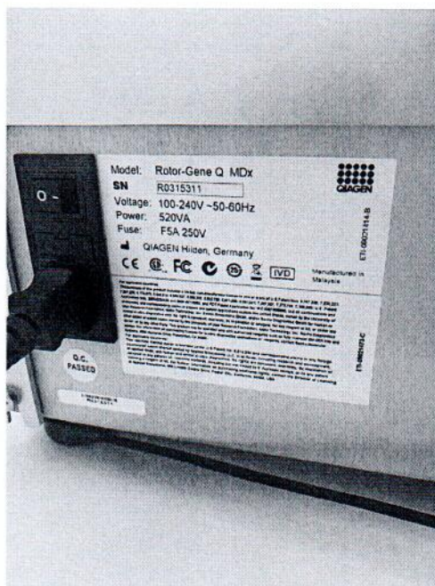
Рисунок 1.2 – Фотография маркировки амплификатора в режиме реального времени Rotor-Gene Q MDx №R0315311