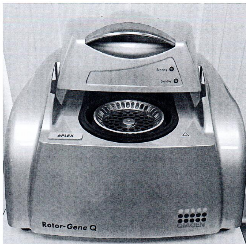
Рисунок 1.1 – Фотография общего вида амплификатора в режиме реального времени Rotor-Gene Q MDx №R0315311

Фотография общего вида средств измерений