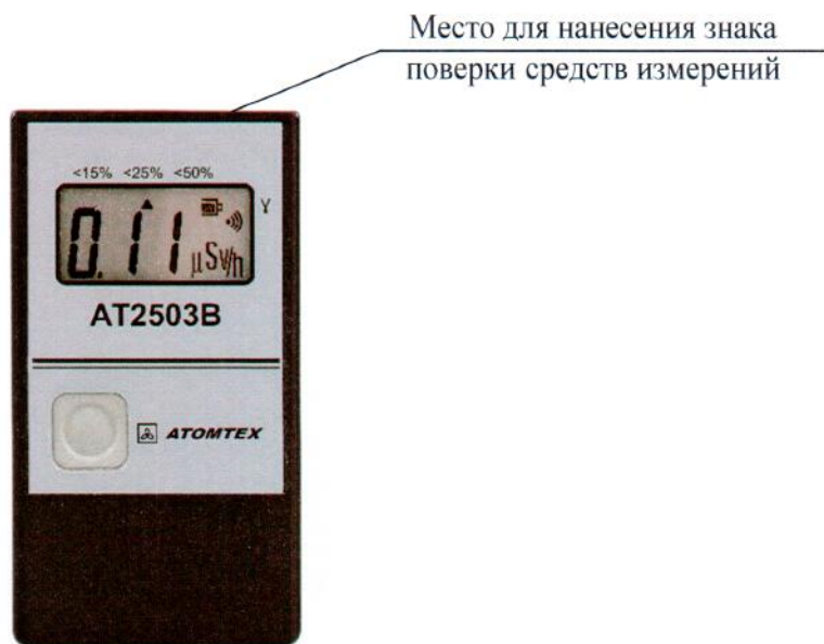
Рисунок 2.1 – Схема (рисунок) с указанием места для нанесения знака поверки средств измерений

Схема (рисунок) с указанием места для нанесения знака поверки средств измерений