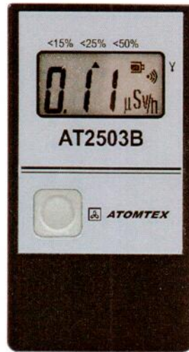
Рисунок 1.1 – Фотография общего вида дозиметров (изображение носит иллюстративный характер)