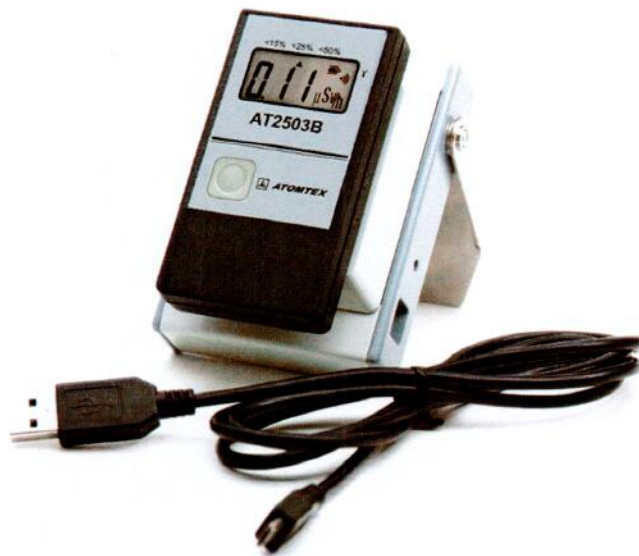
Рисунок 1.2 – Фотография общего вида дозиметров совместно с устройством считывания (изображение носит иллюстративный характер)