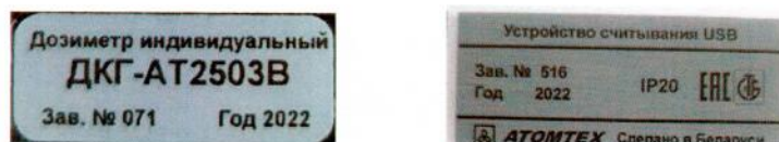
Рисунок 1.3 – Фотографии маркировок дозиметров и устройства считывания (изображение носит иллюстративный характер, дата изготовления указывается в руководстве по эксплуатации в разделе «Свидетельство о приемке»)