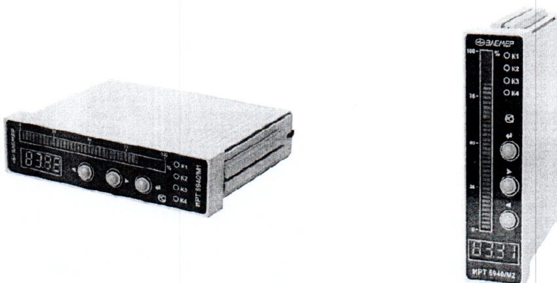
Рис. 1 – ИРТ 5940/М1, ИРТ 5940/М2