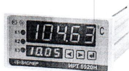
Рис.3 – ИРТ 5920Н, ИРТ 5920НМ